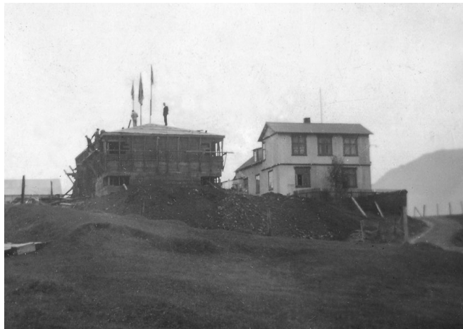
Núverandi prestsetur í byggingu. Eldra prestsetrið hægra megin.