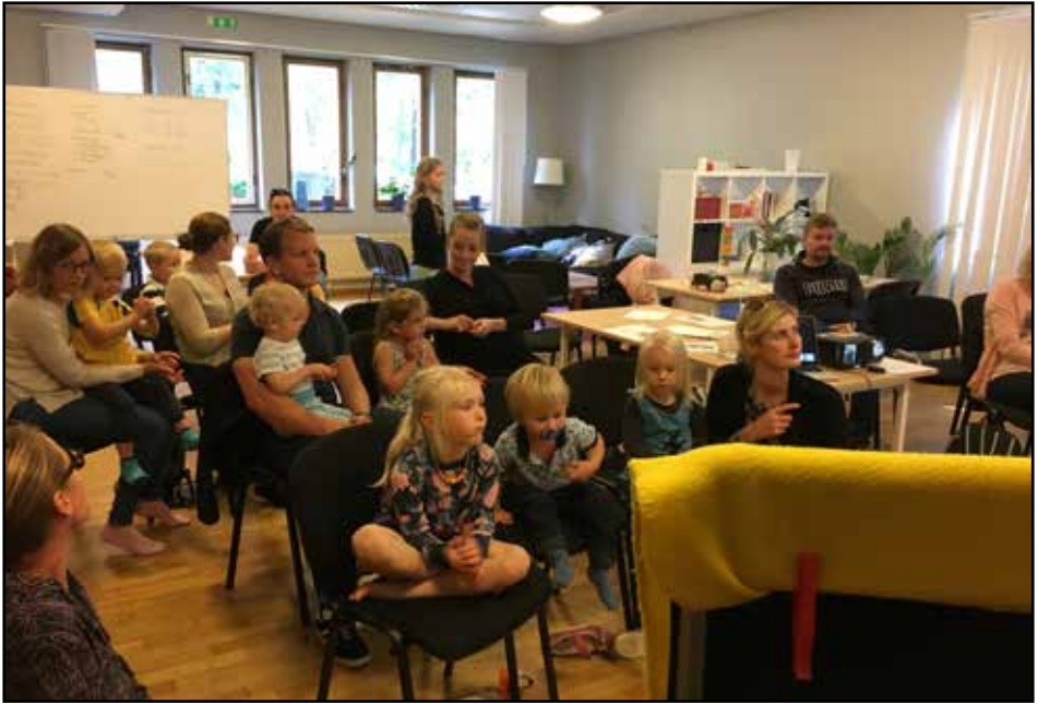
Kirkjuskóli í Gautaborg

Gautaborg og nágrenni. En velkomið er að samband og athuga hvaða möguleikar eru fyrir hendi. Prestur hefur ásamt sóknarnefnd lagt áherslu á að reyna að koma á reglubundnu barnastarfi með hjálp heimafólks sem víðast um land. Það hefur tekist í Stokkhólmi og Lundi eins og áður er nefnt. Við hvetjum áhugasama um íslenskt safnaðarstarf í Svíþjóð til að hafa samband og ræða góðar hugmyndir.