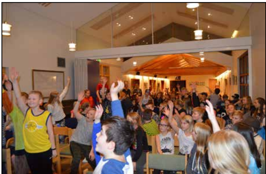
Fjör og gleði á sameiginlegu TTT móti Húnavatns- og Skagafjarðarprófastsdæmis