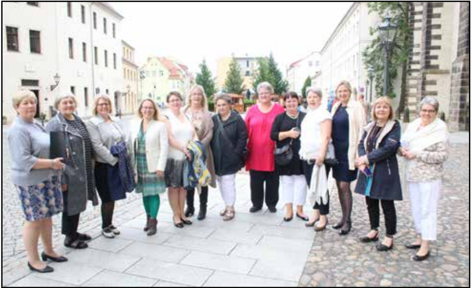
Nokkrar af konunum í kirkjunni