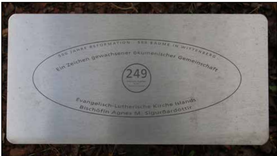
Skjöldurinn við eplatréð í Lúthersgarðinum í Wittenberg

Lúter einu sinni að hafa sagt. Þessi tilvitnun er rótin að fallegum minnisvarða um siðbótina hér í Wittenberg.