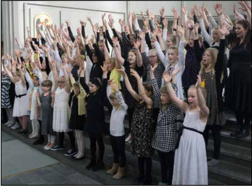
Söngdagur barnanna í Hallgrímskirkju á skírdag 2017

Ég hef einnig haft umsjón með 1. des. messunni, æft sönginn og stýrt honum. Eftir samtal við Ríkisútvarpið 2015 var ákveðið að tæknimenn taki upp messuna og henni sé útvarpað 2. sd. í aðventu. Þannig hefur messa guðfræðinema aftur komist inn í dagskrá RÚV og er það vel.