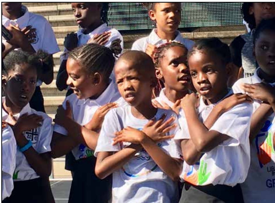
Börnin á heimsþinginu

hans til kirkjunnar því sterk; ef við ætlum að bera fram trúverðugan boðskap um kristinn mannskilning ber okkur skylda til þess að ræða þessi mál. Málefni flóttamanna og náttúrvernd voru einnig mikið til umræðu á þinginu.