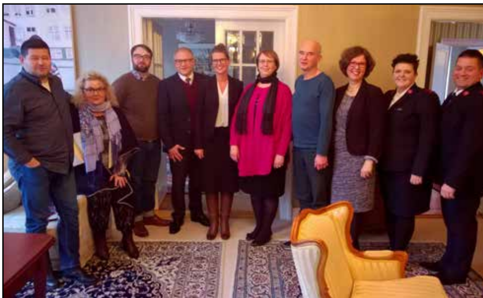
Samstarfsnefnd kristinna trúfélaga þáði heimboð biskups í bænaviku 2017

blaði Hjálparstarfs kirkjunnar, Margt smátt , í júní 2016 (2. tbl. 28. árg, bls. 13). Vilji einstaklingar eða söfnuðir styrkja þetta málefni er reikningur Hjálparstarfs kirkjunnar 0334-26-27, kt. 450670-0499, og skrifa skal SKT í skýringar.