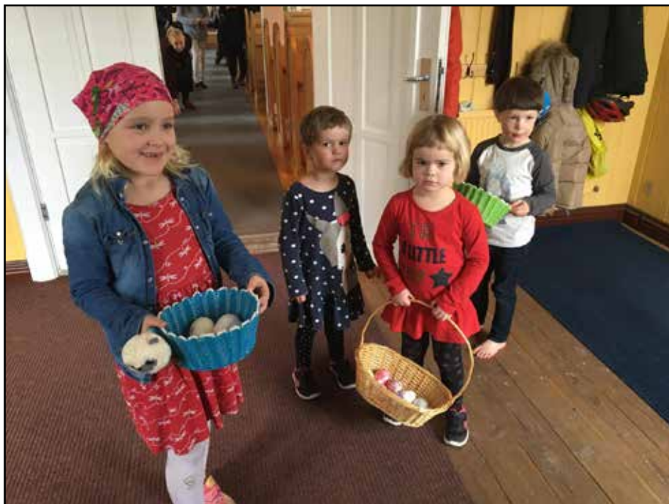
Páskaeggjaleit í kirkjunni