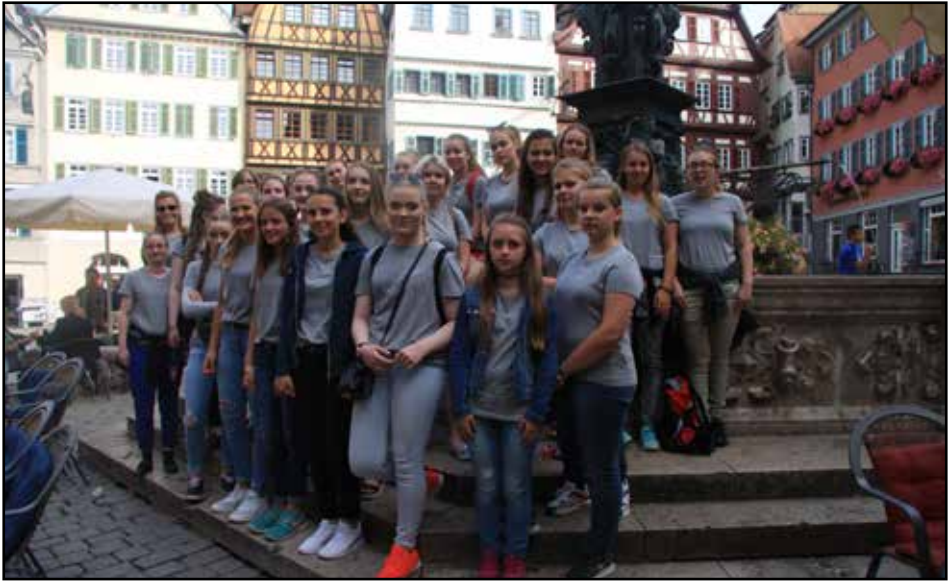
Þátttakendur í Girls4Girls verkefningu

sömu erindagjörðum. Í ár vorum við gestgjafarnir og vorum við stolt af því að geta boðið upp á þann aðbúnað sem Kirkjumiðstöð Austurlands býr nú yfir.