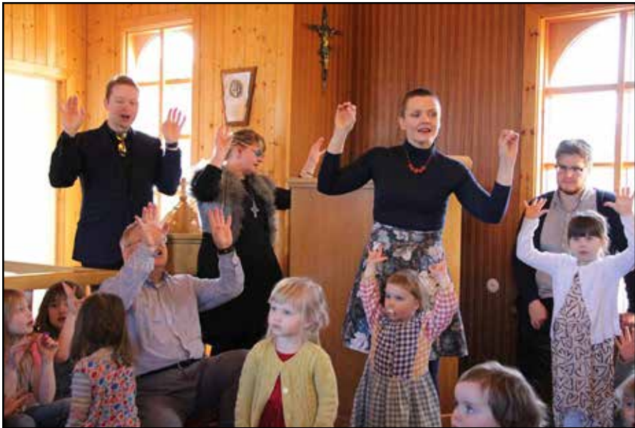
Hreyfisöngvar sungnir á sameiginlegri kirkjuskólahátíð