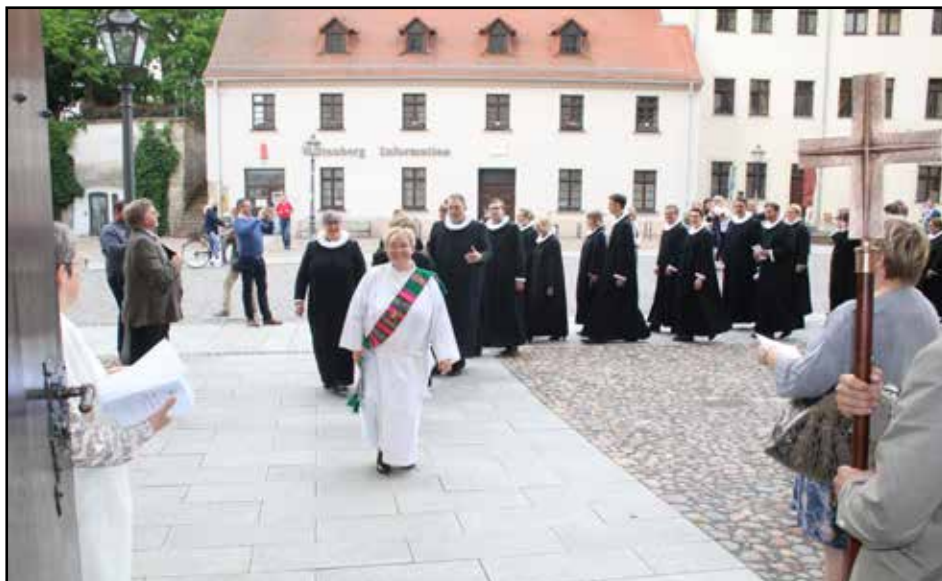
Gengið til setningarguðsþjónustu Prestastefnu 2017

þúsund manns halda því uppi, flestir sem sjálfbóðaliðar. Þar má nefna sóknarnefndarfólkið og kirkjukórsfólkið auk allra hinna sem koma að starfi kirkjunnar beint og óbeint.