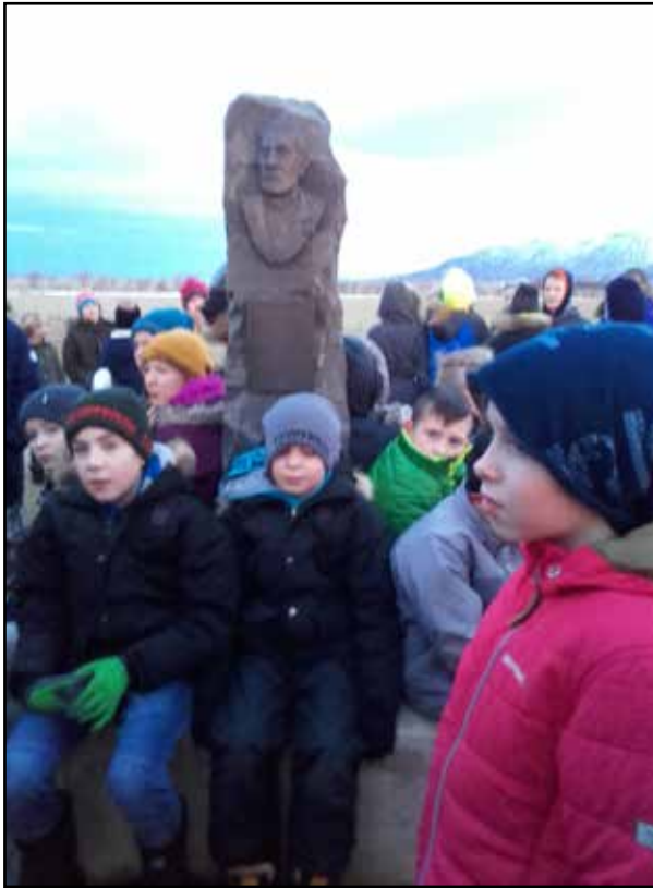
Gönguferði á TTT móti

starfsfólk var og afar elskulegt. Námskeiðið sem setið var að þessu sinni nefndist Að prédika frá pálmásunnudegi fram á páskadag .