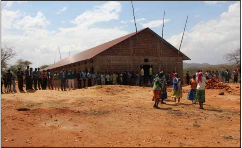
Kirkjan í Chepkobegh sem notið hefur góðs stuðnings velunnara hér á landi.

og senda kristniboða til starfa. Kristniboðssambandið vinnur einnig að kynningarstarfi, vitundarvakningu og boðun hér á landi m.a. í samstarfi við margar sóknir landsins. Kristniboðssambandið er sjálfstæð samtök sem starfa innan þjóðkirkjunnar á kenningargrundvelli evangélískrar lúterskrar kirkju.