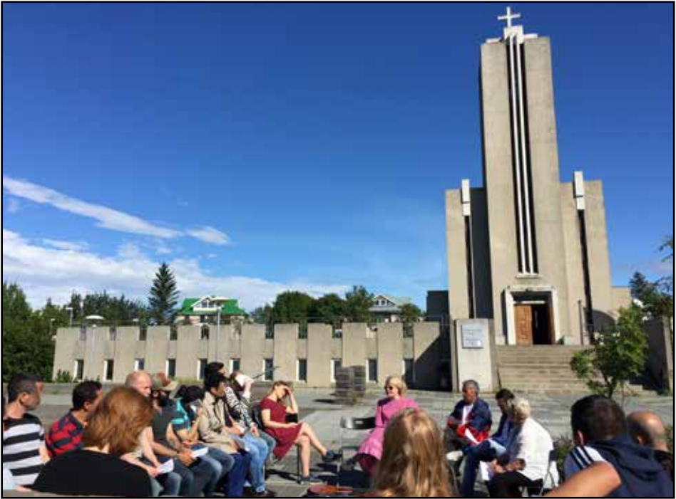
Frá bænastund í Laugarneskirkju

Bænasamkoma var upphaflega haldin á föstudögum kl. 11 en síðan breytist dag- og tímasetning í á sunnudögum kl. 14 (7. jún.). Þegar ensk messa er haldin annað hvort í Breiðholtskirkju eða í Hallgrímskirkju, þá fellur bænasamkoman niður og fólkíð er hvatt til að mæta í enska messu.