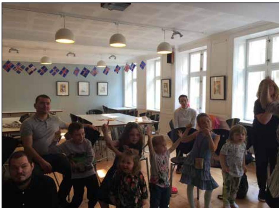
Sunnudagaskóli í Jónshúsi í Kaupmannahöfn