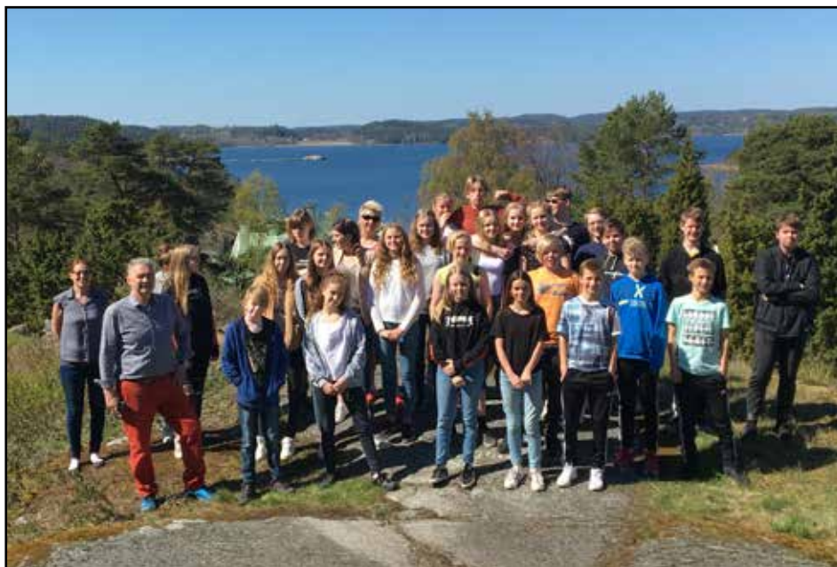
Fermingarbarnamót vorið 2017

Kaupmannahöfn. Kvinnakórinn Dóttir söng fyrir okkur á aðventuhátíð 2016 og einnig við guðspjónustu í maí 2017.