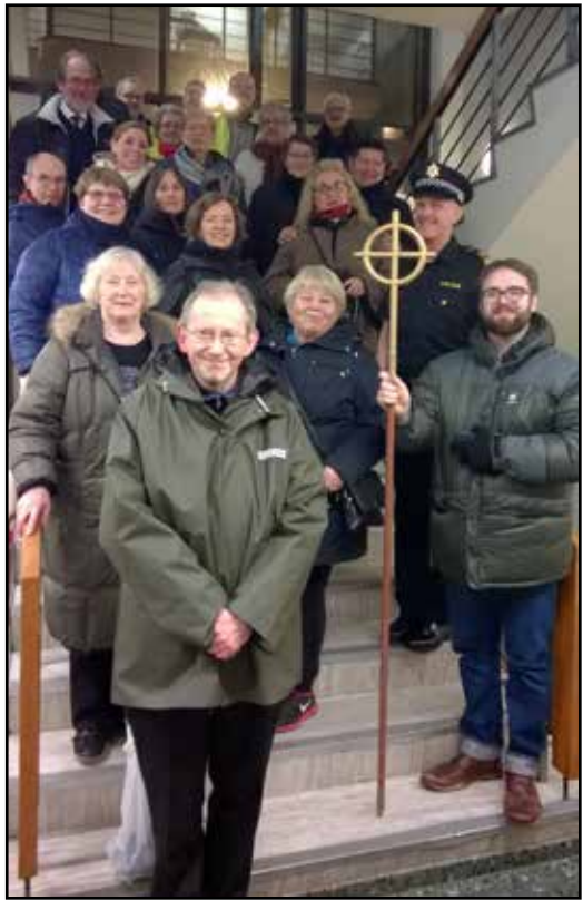
Bænagöngufólk í janúar 2017 á lögreglustöðinni við Hlemm