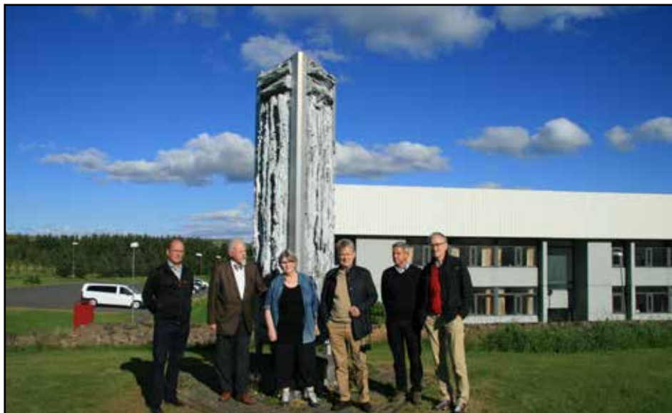
Úr ferð Kirkjugarðaráðs um Borgarfjörð