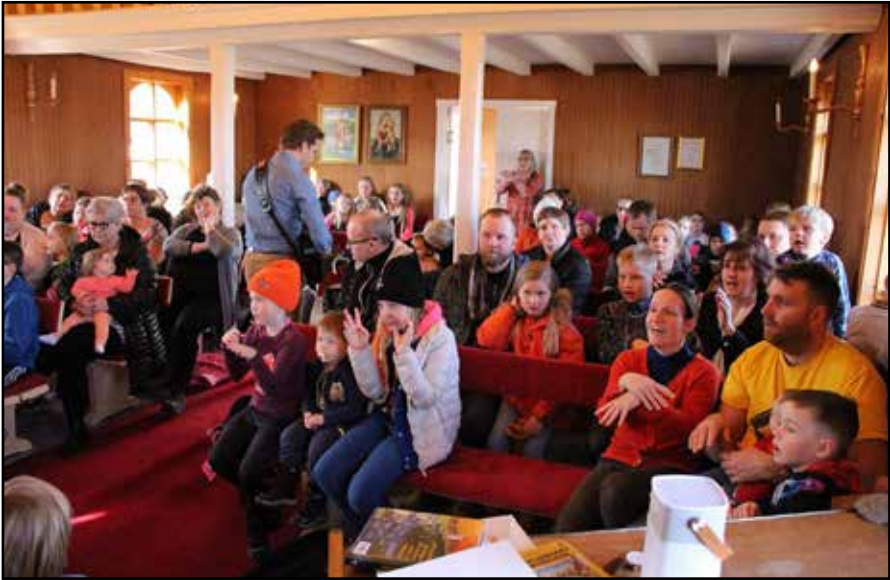
Kirkjugestir á kirkjuskólahátíðinni

fyrir foreldra ungra barna. Fermingarbörnum hefur fækkað á Ísafirði. Síðastliðinn vetur voru einungis 20 fermingarbörn í fræðslu en undanfarna tvo áratugi hafa þau lengstum verið um fimmtíu talsins. Er þetta í takt við fækkun fólks á svæðinu og breytta aldurssamsetingu. Athyglisvert er að af þessum 20 börnum þá eru 16 skráð í Þjóðkirkjuna. Eitt er skráð í Fríkirkjuna í Hafnarfirði og þrjú tilheyra Kapólsku kirkjunni. Ekkert þjóðkirkjubarn í árganginum valdi það að fermast ekki.