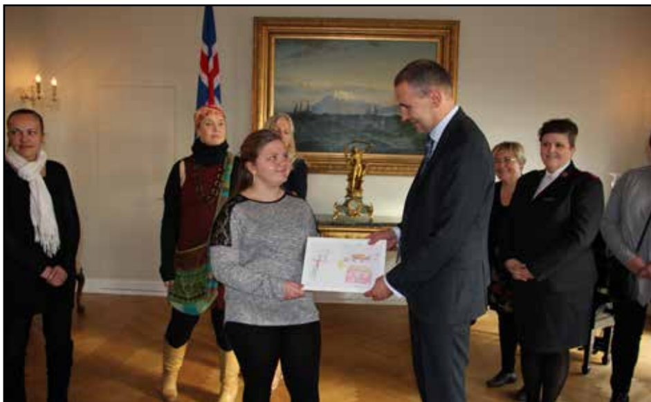
Forseta Íslands Guðna Th. Jóhannessyni afhent mynd þar sem fátækt á Íslandi er séð í augum átta ára barns í tilefni alþjóðabaráttudags gegn fátækt 17. október 2016

fólk í margvíslegri neyð. Bæði félög og hið opinbera eru hvött til að vera opin gagnvart fólki sem er útskúfað eða fær ekki að vera virkir þátttakendur í daglegu lífi venjulegra borgara eða eru á flótta. Svo segir: „Við munum halda áfram kærleiksstarfi sem er byggt á kristinni trú og innblásin af fordæmi Krists sem byggist á þremur atriðum: talsmannshlutverkinu (advocacy), félagslegum störfum og kærleika.“ Gestrisni er eitt af grundvallaratriðum kærleikspjónustunnar.