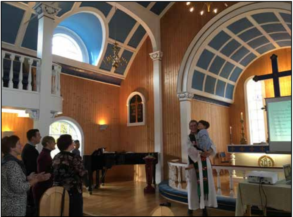
Fjölskylduguðsþjónusta í Seyðisfjarðarkirkju