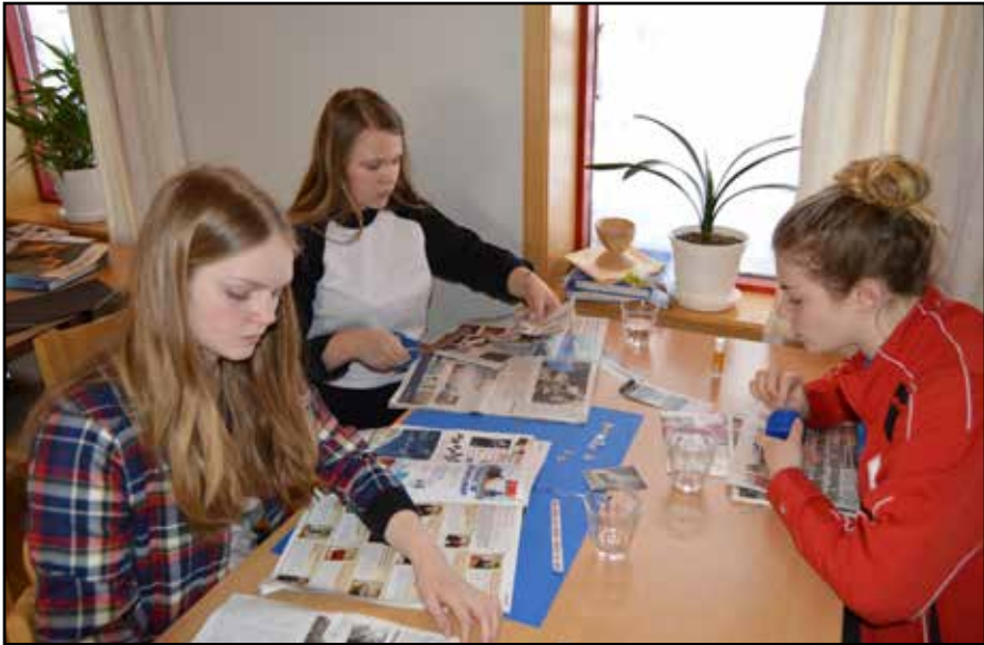
Hópvinnu í fermingarfræðslunni