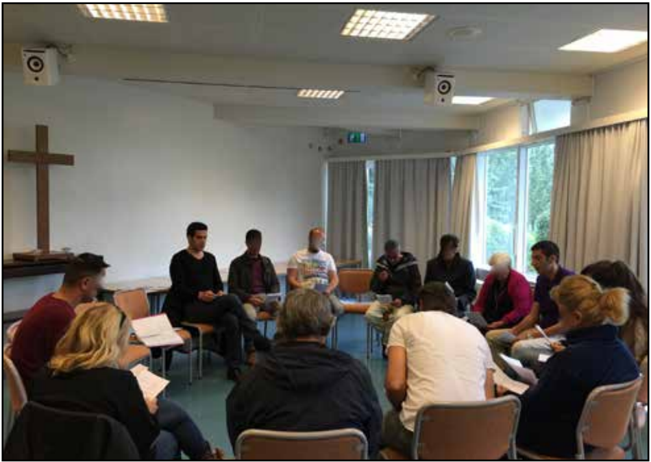
Frá bænastund í Hjallakirkju